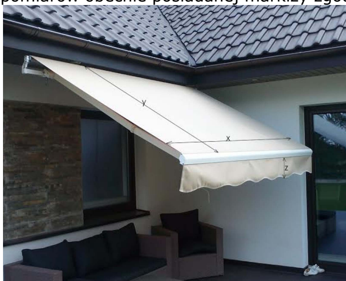
Rys. 1: Wymiary markizy