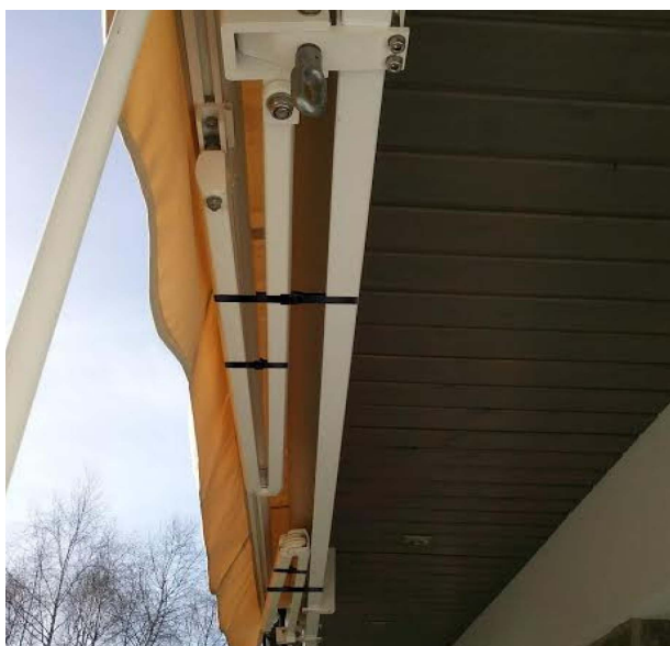
Rys. 2: Zabezpieczenie ramion wysięgu przed wymianą pokrycia